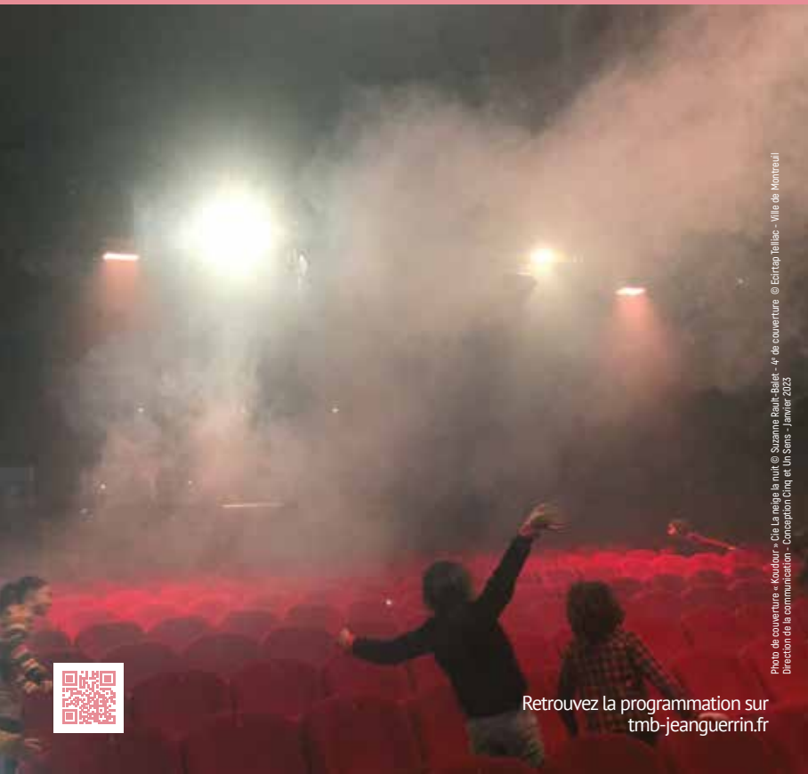
Photo de couverture « Kaudour » de La neige la nuit - Ar de couverture © Ecartap l'ellac - Ville de Montreuil Direction de la communication - Conception Cinq et Un Sens - Janvier 2023

6, rue Marcelin Berthelot - 93100 Montreuil Métro Croix-de-Chavaux 01 71 89 26 70 - resa.berthelot@montreuil.fr tmb-jeanguerrin.fr www.facebook.com/theatreberthelot @berthelothetre